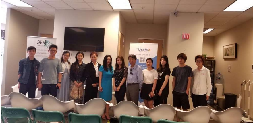
一起工作的小伙伴们，于新闻发布会之前拍摄：